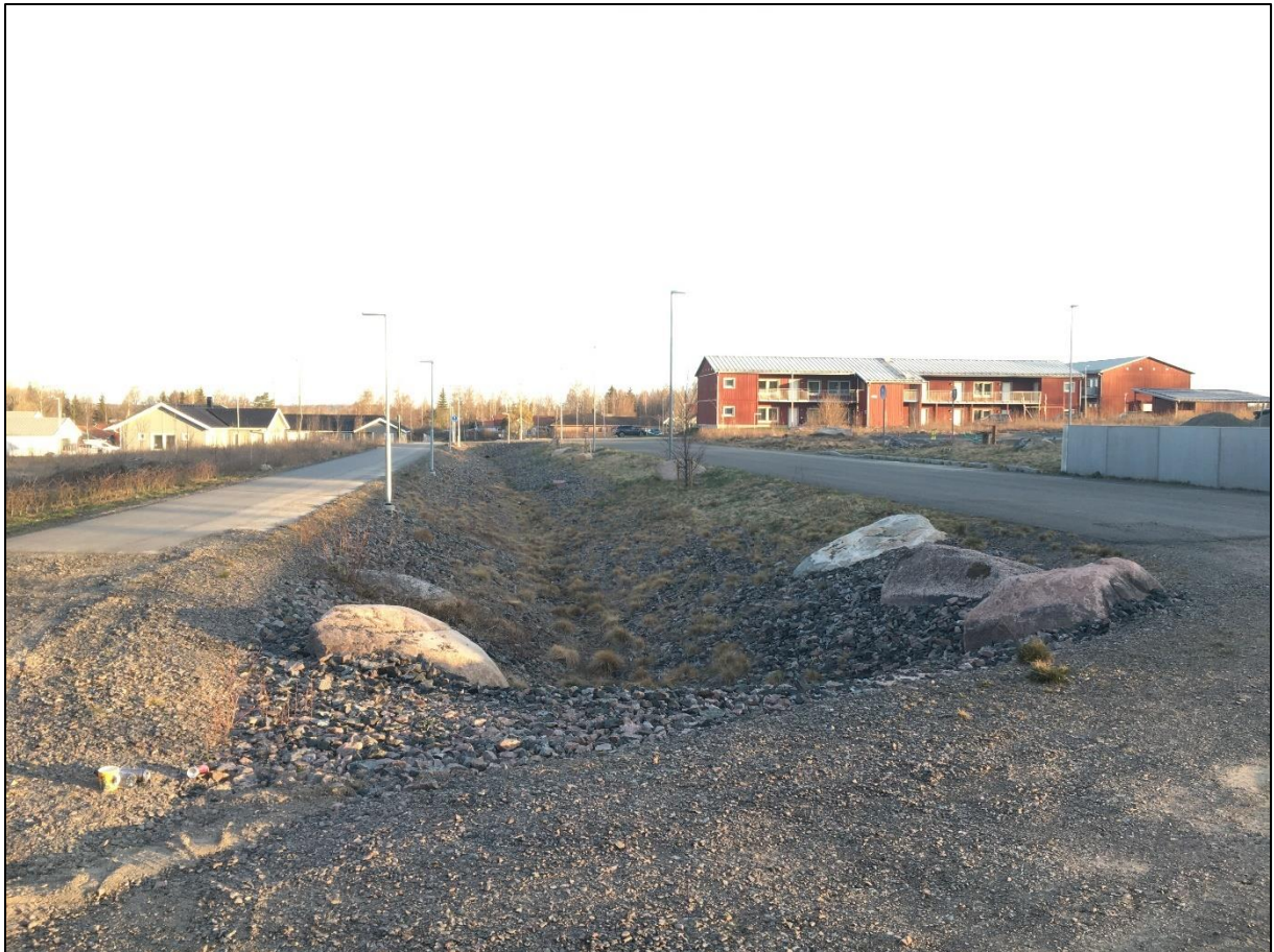
Figur 3 Nuläge, NATUR dike längs med Runstensgatan sett från söder.