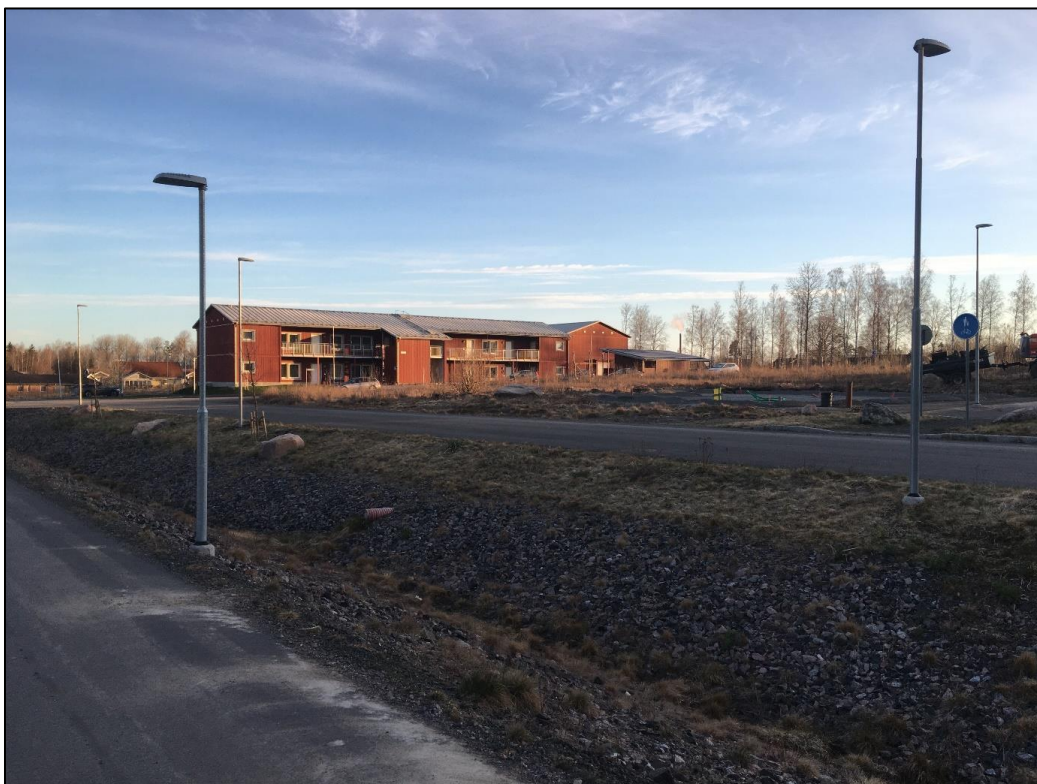
Figur 9 Nuläge, sett mot Sibbes gata 10.