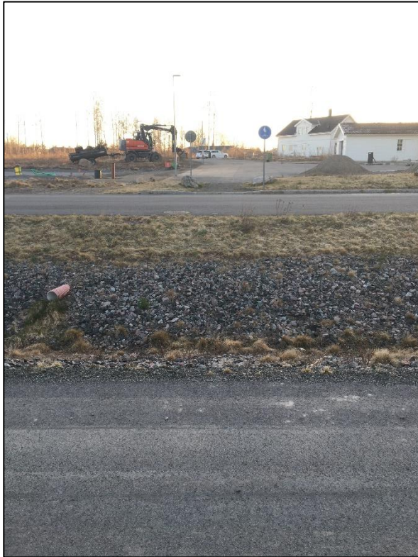
Figur 6 Nuläge, sett mot Sibbes gata 10.