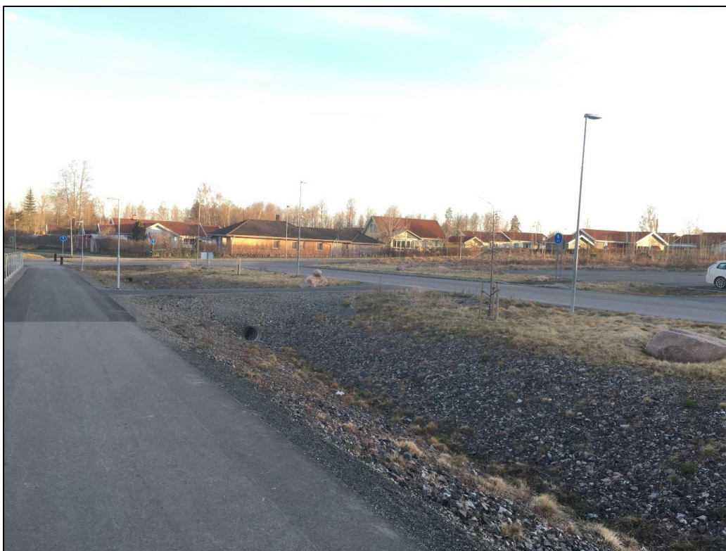
Figur 8 Önskat läge, likt Järps gata.