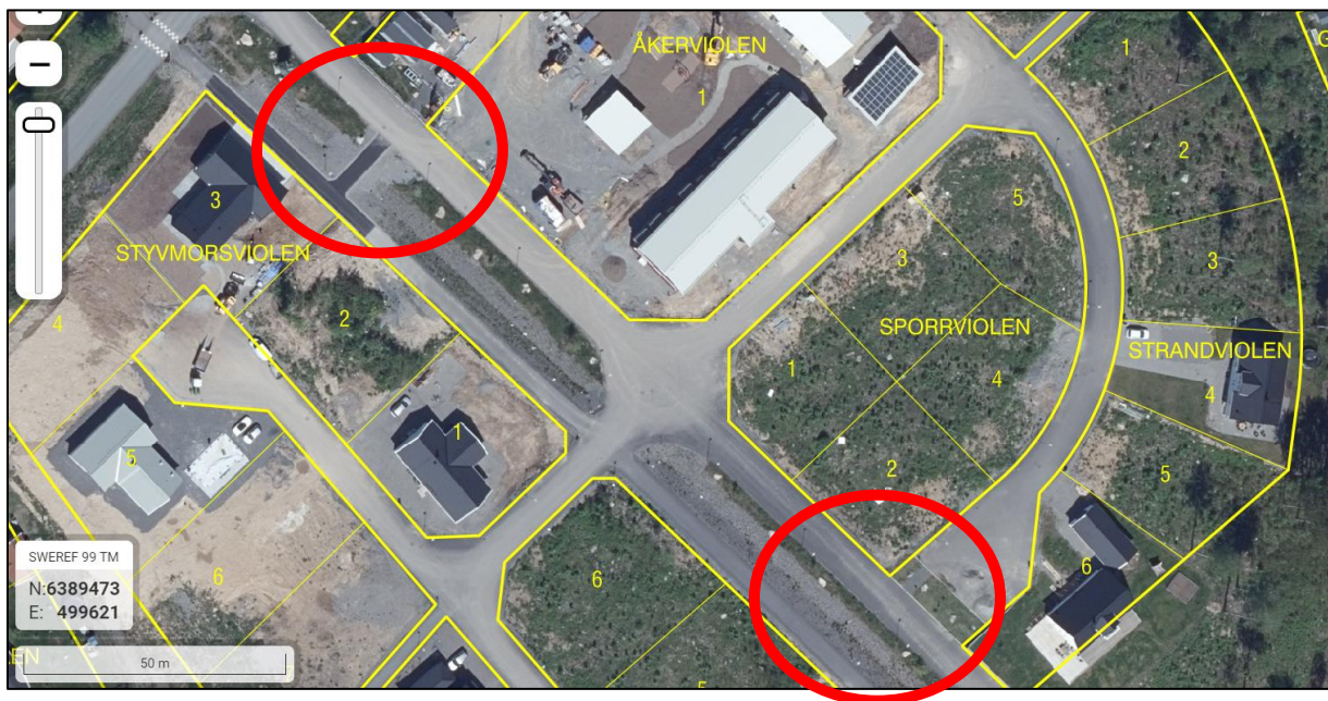
Figur 2 Jämförelse mellan GC-väg anslutning över dike mot Åkerviolen kontra Sporrviolen.