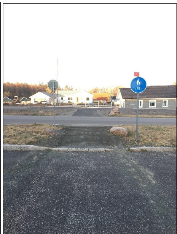
Figur 5 Önskat läge, likt Järps gata.