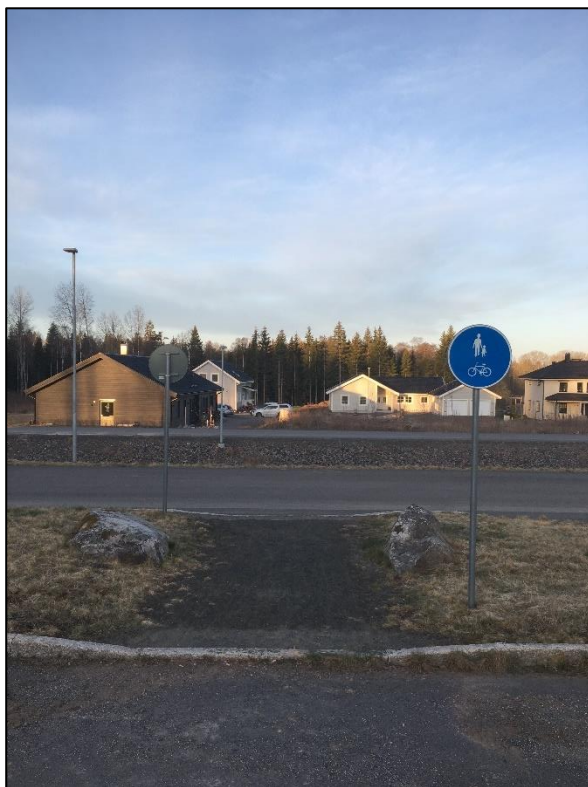
Figur 4 Nuläge, sett från Sibbes gata 10.