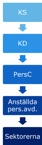
Figur 3. Eksjö's uppsiktskedja i personalfrågor