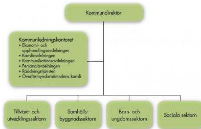
Figur 2. Förvaltningsorganisation i Eksjö kommun

Kommunfullmäktige har beslutat att samtliga Eksjö kommuns verksamheter ska tillhöra en och samma förvaltning. Förvaltningen leds av kommundirektören. Inom förvaltningen finns en sektor kopplad till respektive nämnd, samt ett kommunledningskontor som fungerar som en stödfunktion för kommunstyrelsen, övriga politiska organ och sektorerna.