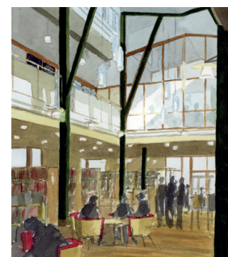
Akvareller: Lasse Samuelson