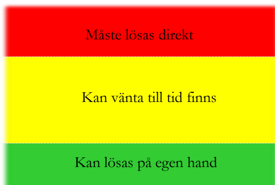
Bild visar konfliktskalan Grönt=Kan lösas på egen hand, Gult=Kan vänta till tid finns Rött=Måste lösas direkt