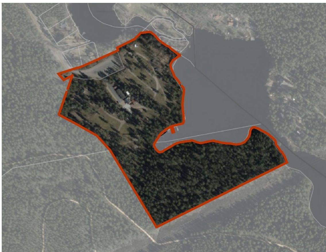
Figur 2: Illustration över planområdet inringat i rött på ett ortofoto.

Planområdet är beläget strax öster om Mariannelund intill Åsjön och nås genom att svänga av till Spilhammarvägen från riksväg 40. Området omfattar Spilhammars camping som ligger på privat mark samt mindre område för parkering på kommunal mark. Området är på drygt 7 hektar och regleras idag genom områdesbestämmelser. Del av planområdet används idag för campingverksamhet medan delar till stor del består av skogsområde. Planområdet omfattar även ett mindre vattenområde för bryggor. Delar av planområdet är ett så kallat LIS-område och möjliggör landsbygdsutveckling i strandnära läge. I princip hela planområdet ligger inom det generella strandskyddet och delar av det avses genom ny detaljplan upphävas.