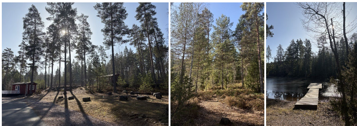
Figur 3: Bilder från planområdet på befintligt campingområde, skogsmark och badbrygga.

Planområdet består av befintligt campingområde med campingstugor, servicehus, grusvägar, ställplatser för husbil, husvagn och tältplatser. I området finns även mindre badplats med badbrygga, belysning och en anlagd parkeringsplats. Drygt 3 hektar av planområdet består av skog. Hela området sluttar mer eller mindre ner mot Åsjön i öster och omges i övrigt av ett större natur och rekreationsområde. I norr gränsar planområdet till ett par bostäder.